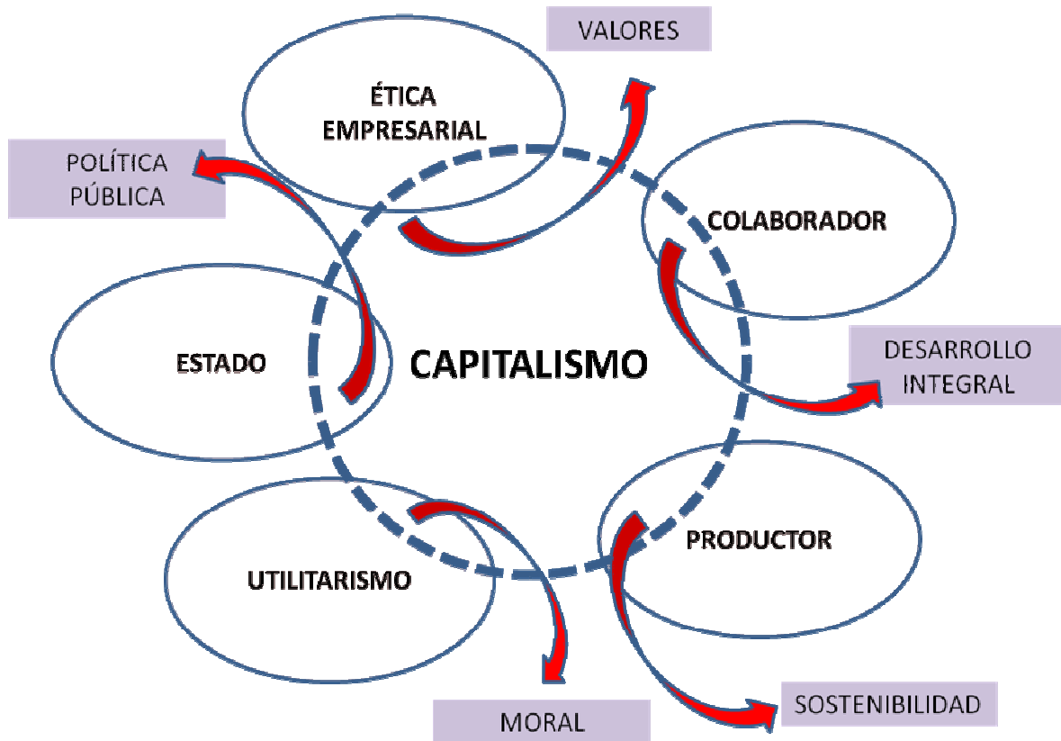
Figura 1. Capitalismo y Utilitarismo